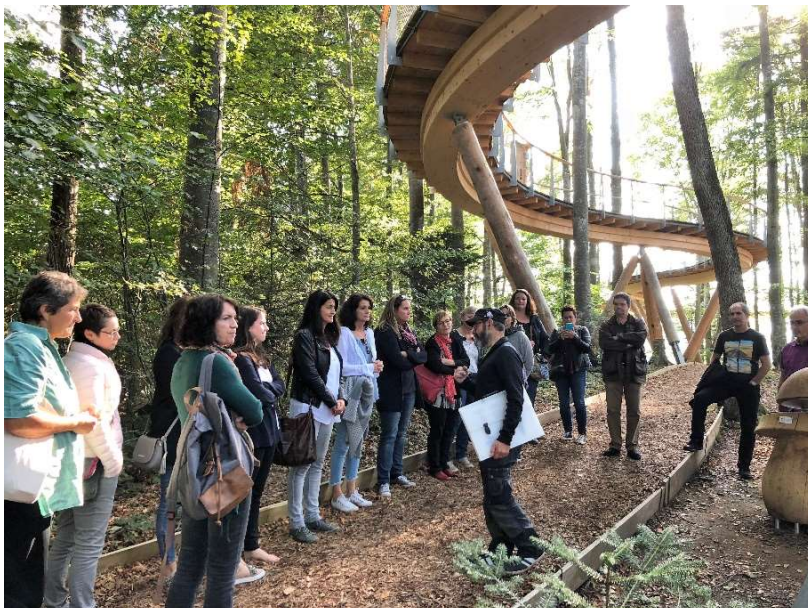
Schulrat-Lehrerausflug Baumwipfelpfad Mogelsberg